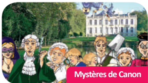
Mystères de Canon