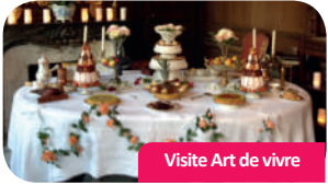
Visite Art de vivre

Un des plus beaux jardins de France à découvrir en s'amusant !