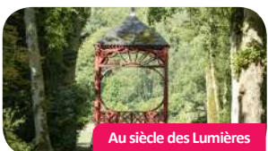
Au siècle des Lumières

Visite guidée qui aborde les grandes thématiques du siècle des Lumières, de l'intérieur du château au parc et aux jardins.