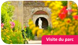
Visite du parc